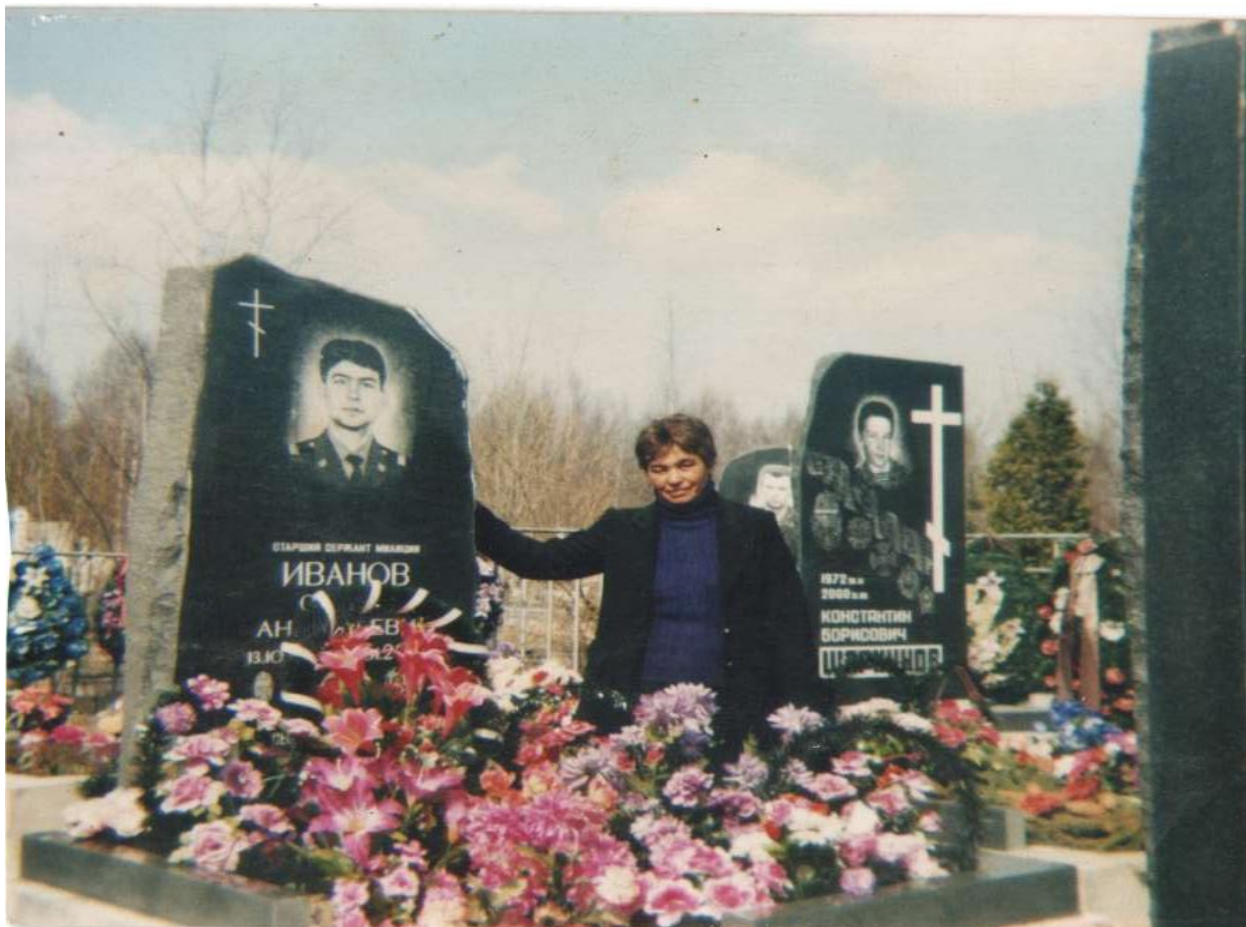
На могиле сына в г. Санкт-Петербурге на Южном кладбище.